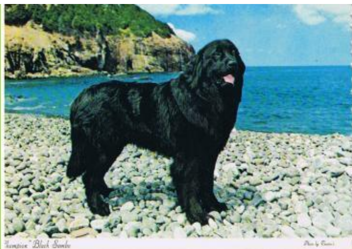
Newfound Black Dog

Собак уже давно используют в качестве спасателей. У них отличные нюх и слух. Собаки способны находить людей под снежными завалами, в пылающем здании, под разрушенными строениями.